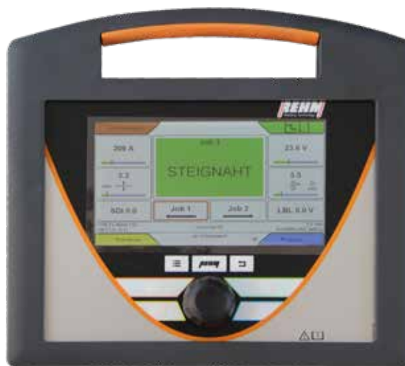
Jobmodus für das Arbeiten mit gespeicherten Programmen