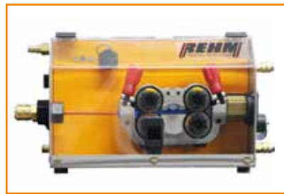
Kompakter und robuster Vorschubkoffer