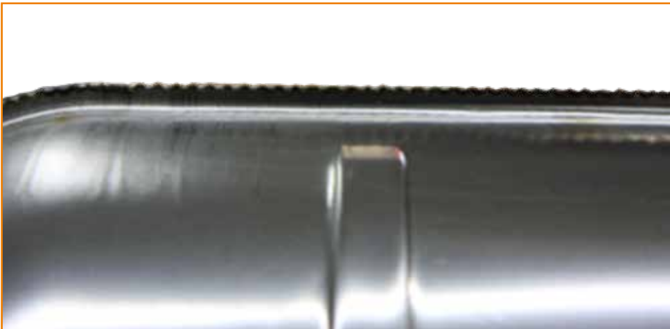
Edelstahl Tank mit 250 Heftpunkten

Alle Heftpunkte sind identisch ausgeführt.