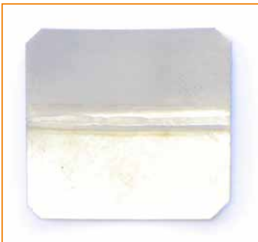
Musterblech 0,2 mm