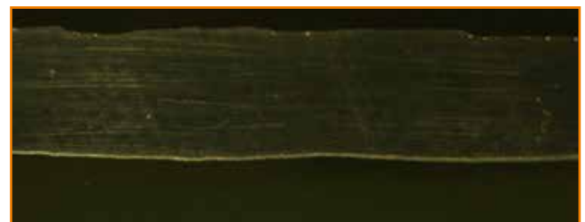
Reparaturschweißung mit DualWave geschweißt. Deutlich weniger Poren.