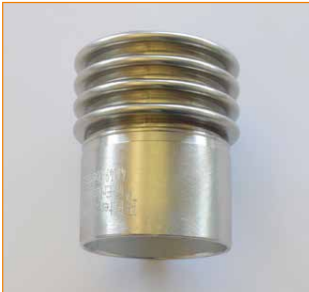
Rundschweißung | Brenner handgeführt (3,0 mm an 0,2 mm)