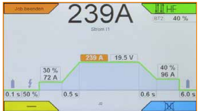
DC ohne Puls. Alles nicht aktive wird ausgeblendet