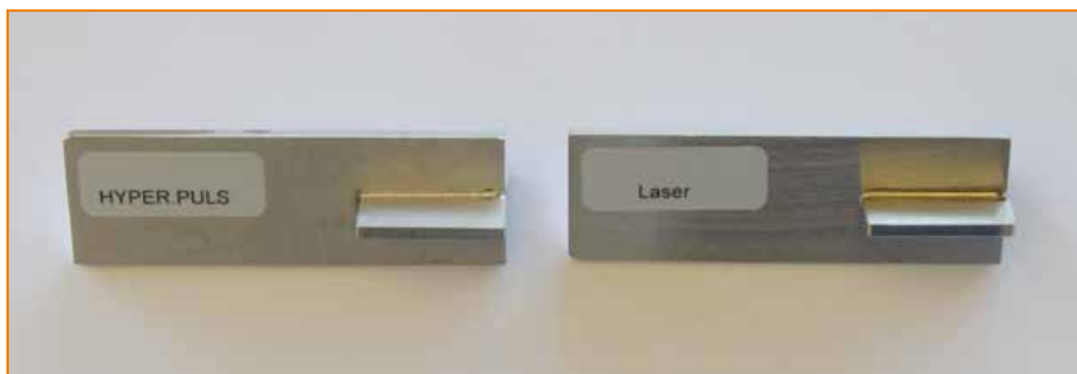
Ecknaht für Pharmatechnik | ohne Zusatz, Brenner handgeführt