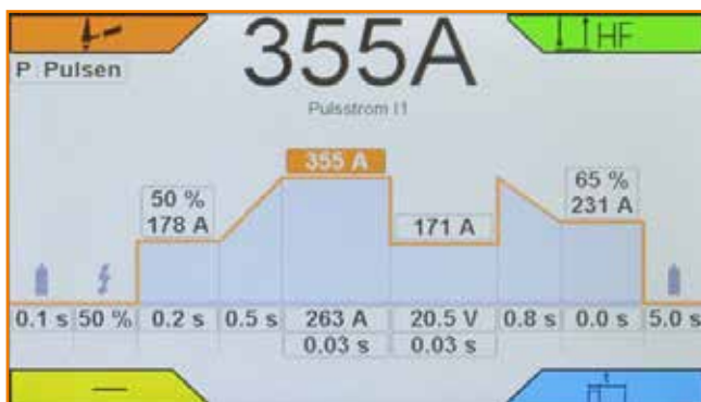
Bildschirm im Tagmodus