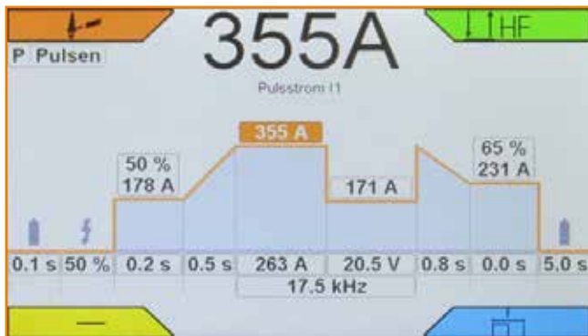
HYPER.PULS mit allen Einstellungen auf einen Blick