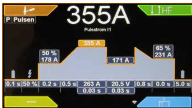
Bildschirm im Nachtmodus