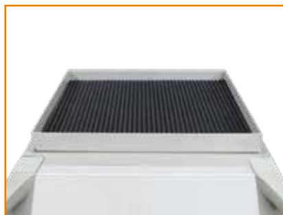
Toolbox für Kompaktgeräte SA (1381115)

Machen Sie, mit den möglichen Optionen und der nachrüstbaren Ausstattung, unsere Schweißgeräte zu Ihrer individuellen Maschine.