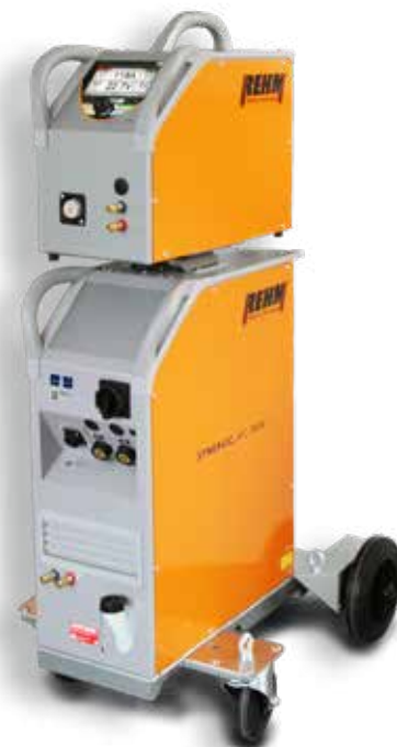
SYNERGIC.ARC 304-504 WS