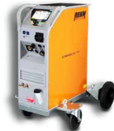
SYNERGIC.ARC 304-504 W