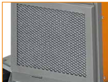
Nachrüstset Luftfiltervorsatz (1381353)